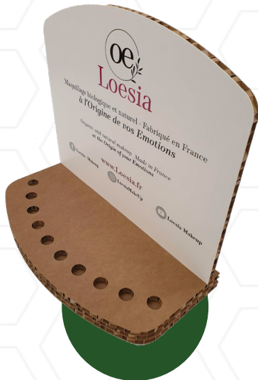
Présentoirs de comptoir