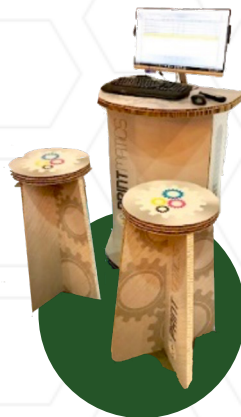
Habillage et mobilier de stands d'exposition